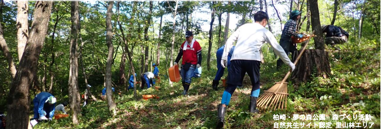
柏崎・夢の森公園 森づくり活動 自然共生サイト認定 里山林エリア

自然を守るというと「人は立ち入らず、自然をそのまま残すこと」がよいと思われがちです。原生林など保護が必要な自然もありますが、日本の里地里山に広がる林地や草地、湿地の多くは、草刈りや水管理といった人の営みによって維持されてきました。近年は管理の担い手が減り、こうした環境が失われつつあります。自然と共生するまちは実現には、人が自然に関わり、その恵みを受けながら適切に手入れを続ける必要があります。人と自然の関わりを取り戻すことが、生物多様性を守るための大切な一歩となります。