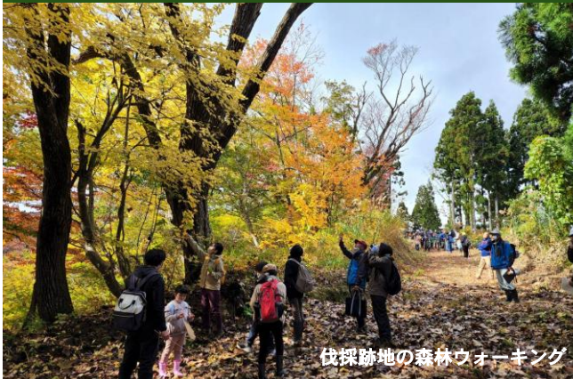
伐採跡地の森林ウォーキング