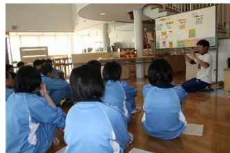
担任の先生からのメッセージ。進行を夢の森公園スタッフに任せることができるので、子どもたちの様子をよく観察することができます。