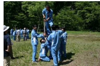
夢の森公園での実践例。いつもと違う自然に囲まれた環境の中で活動することができます。足定との組み合わせもよく見られます。

積極的か消極的かという表出の仕方（doing）と、自分がどんなあり方をするか（being）をかけあわせたマトリクスです。現在子どもたちがどのような状態にあるか、なぜそうなっているのかなどについて、先生方にお聞きしながら最終的なプログラムを構築します。