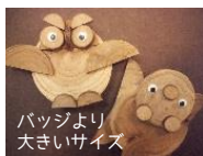
バッジより大きいサイズ